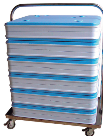
Carro Bandejas Isotérmicas Isothermal Trays Trolley Chariot pour Plateaux Isothermes